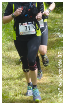
Un chrono zéro déchet grâce à ses lacets !

Vous pouvez choisir des puces, s'attachant aux lacets de chaussures . Ces systèmes,