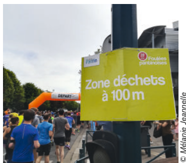
Zone « déchets » en vue lors des Foulées pantinoises de 2018

L'optimisation du système de tri se fait en 4 étapes : identifier le service de collecte et de traitement des déchets, qui peut être public (avec le reste des ordures ménagères) ou assuré par des prestataires privés. Choisir les réceptacles adéquats (matériau, forme, couleur) afin de faciliter l'adhésion des usagers (pensez aux sacs poubelles transparents qui facilitent le contrôle). L'emplacement est aussi un facteur de réussite très important : au départ et à l'arrivée d'une course, à chaque ravitaillement ou espace buvette, dans les gradins pour le public, etc. Les poubelles doivent être visibles de loin et accessibles sur le parcours des sportifs.