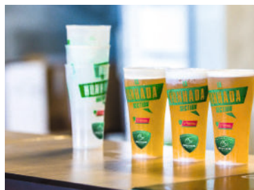
Le rugby s'essaie aux éco-cups

Pour remplacer les gobelets jetables destinés aux sportifs, vous pouvez les inviter à venir avec leur propre gourde (ou proposer des gourdes non datées et consignées) ; mettre en place des gobelets réutilisables consignés (prévoir éventuellement des porte-gobelets) ; ou encore installer des fontaines ou rampes à eau . Pour le public accueilli lors de l'événement, les espaces buvettes des stades et complexes sportifs peuvent également passer aux gobelets réutilisables consignés... La bière d'après-match sera elle aussi zéro déchet ! L'ensemble des éléments de vaisselle existe en réutilisable : à l' achat ou à la location , notamment auprès de votre collectivité.